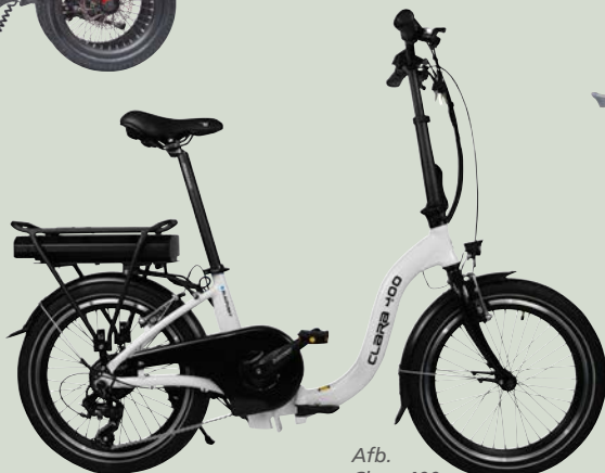
Afb. Clara 400