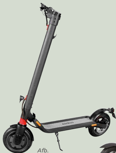
Afb. EM2GO FW106ST