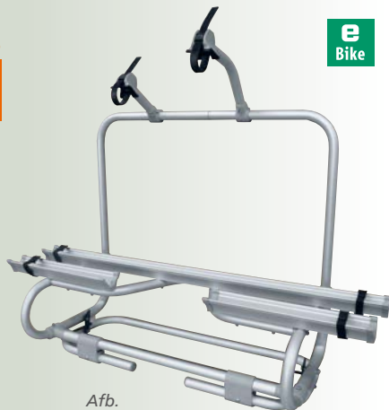
Afb. Fietsrek Premium

Bijzonder stabiele fietsdragers voor eBikes Voor op de dissel, trekhaak of achter uw caravan/camper vindt u online op www.fritz-berger.de of in uw plaatselijke filiaal.