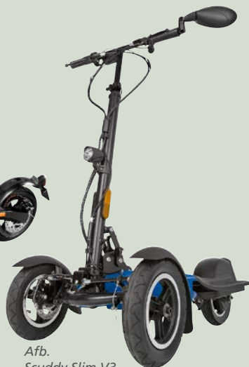
Afb. Scuddy Slim V3