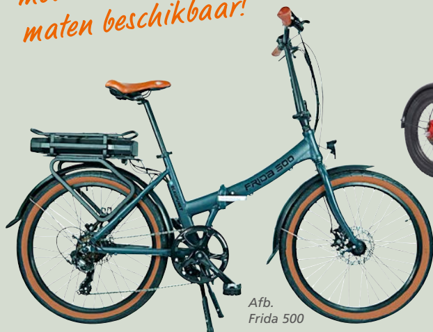
Afb. Frida 500

Veel verschillende modellen, kleuren & maten beschikbaar!